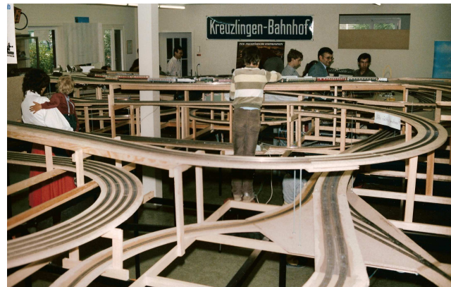
Rohbau unserer Anlage im Mai 1982

Unter dem Jahr gibt es weitere Aktivitäten wie Ausflüge, Grillabende usw.